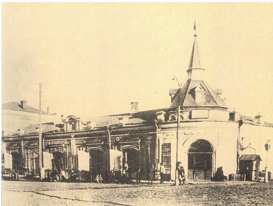
Widok starego Semipałatyńska.