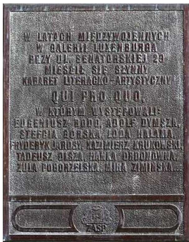
Tablica upamiętniająca teatrzyk Qui Pro Quo i jego artystów na Senatorskiej 29/31 w Warszawie; https://pl.wikipedia.org/wiki/Eugeniusz_Bodo

Był już popularnym aktorem, który wystawnie i beztrzesko żył. Dowodem tego może być fakt, że dnia 27 maja 1929 r., prowadząc swój samochód marki Chevrolet, którym podróżował z Warszawy do Poznania wraz z czterema pasażerami, nocą spowodował wypadek; pojazd na zakręcie wypadł z jezdni i stoczył się 4-metrowego nasypu i w wyniku czego śmierć poniósł aktor Witold Roland. Bodo został skazany na karę 6 miesięcy pozbawienia wolności w zawieszeniu 6 .