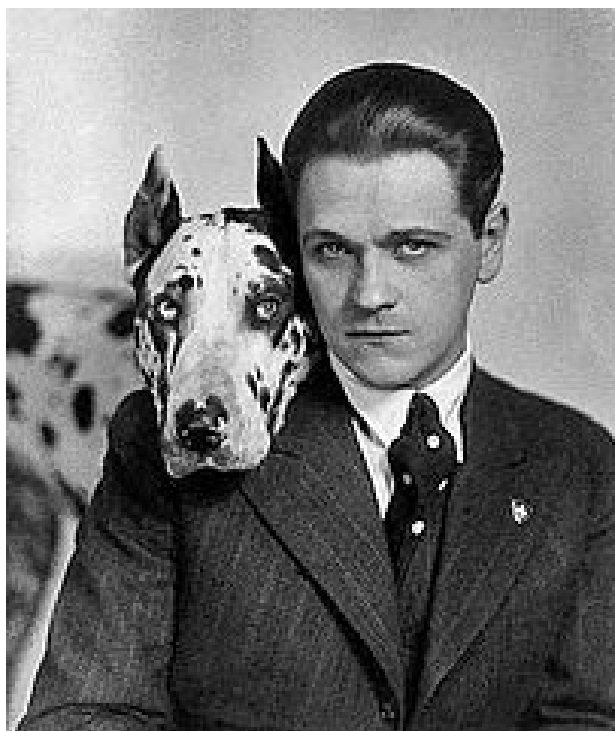
Eugeniusz Bodo ze swoim psem Sambem

Rodzice byli niezadowoleni z jego występów albowiem przeznaczili synowi inną, bezpieczniejszą i bardziej stabilną drogę życiową. Marzyli, żeby został lekarzem. Ich oczekiwania nie doczekały się spełnienia. Osiemnastoletni syn uciekł z domu i zaangażował się do teatryku „Apollo” w Poznaniu. Skrajna bieda nie pozwalała mu na stworzenie własnego repertuaru; co jednak nie przeszkodziło mu w odniesieniu pierwszych sukcesów i w wyjeździe do Warszawy.